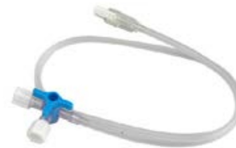
12.02.01/02/03 LAVE DE TRES VÍAS + ALARGADERA

MODELO CON CONNECTOR “LUER LOCK” + ALARGADERA