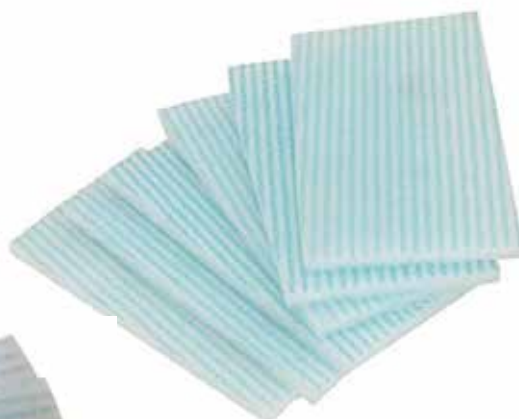
00140004 ESPONJA JABONOSA 12cm x 20 cm x 0,8 cm