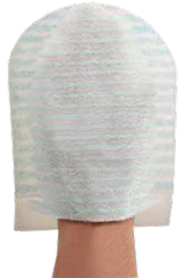
25 cm x 17cm