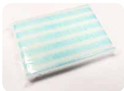
00140003 ESPONJA JABONOSA 8cm x 12 cm x 2cm

Para baños que requieren más limpieza, resultan más resistentes y aportan más gel.