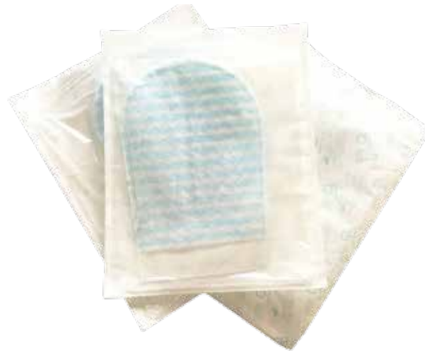
00140101 MANOPLA JABONOSA ENVASE INDIVIDUAL ASÉPTICO