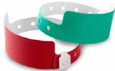
Modelo liso para impresión de logotipo.

El área de impresión es de 70x20mm modelo liso y 70x10mm modelo lineal.