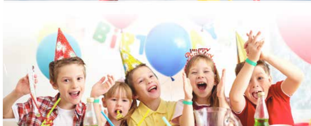
Brazaletes pvc lineal