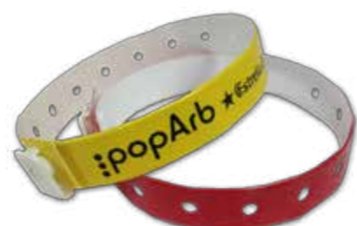
Modelo lineal para impresión de logotipo.