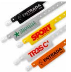
Modelo sin bolsillo