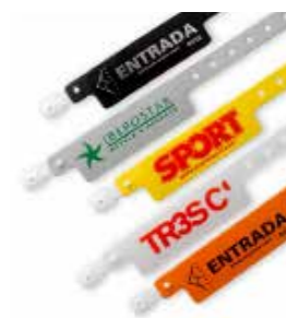
Modelo sin bolsillo