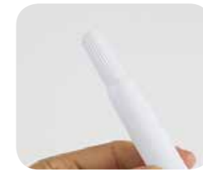
Dedal con estrías para una óptima recolección de células.

ANÁLISIS EN LABORATORIO Entregar la muestra al laboratorio para realizar su análisis VPH y posterior informe.