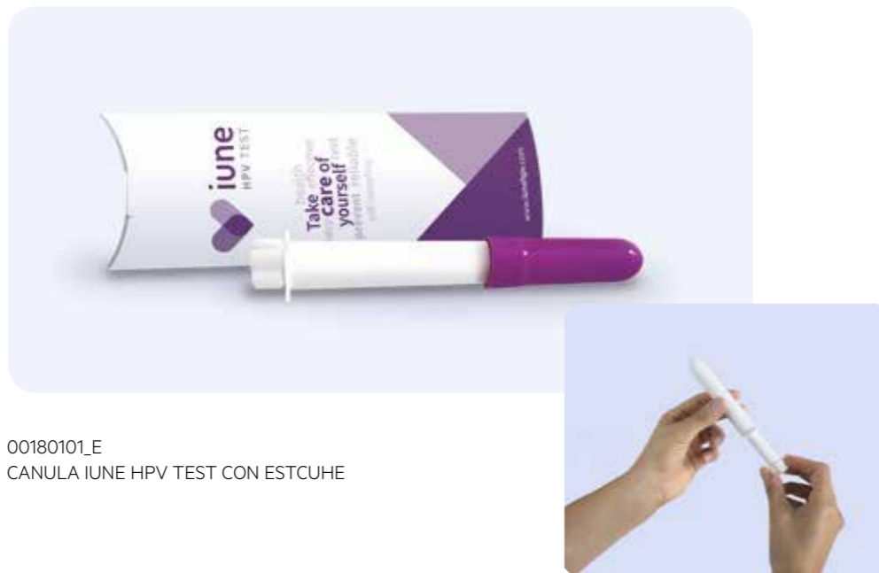
00180101_E CANULA IUNE HPV TEST CON ESTUCHE

IUNE es un dispositivo médico para recoger células del cuello uterino. Se emplea a como un tampón vaginal y una vez utilizado se remite a un laboratorio de análisis En nuestra página www.iunehpv.com también dispone de videos y instrucciones de su funcionamiento.