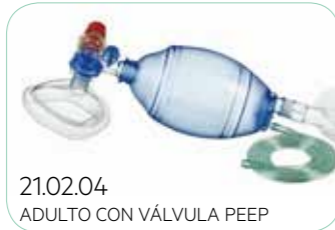
21.02.04 ADULTO CON VÁLVULA PEEP