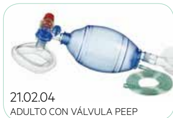
21.02.04 ADULTO CON VÁLVULA PEEP