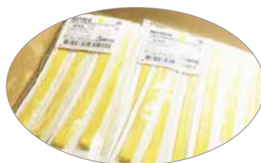
21.05.10 Individual estéril