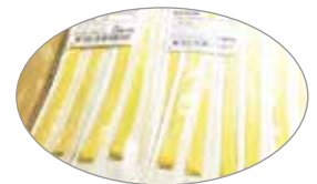
00210510 PRESENTACIÓN ESTÉRIL