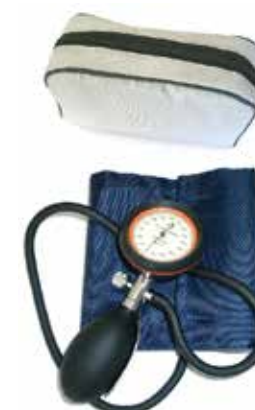
22.00.15 Handy Type 2012