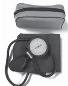
22.00.14 Type 2010 model

Manguito: Velcro de Nylon, adulto de 50x14cm. La cámara contiene látex. Disponemos de cámaras sin látex. Estuche: Negro con cremallera de skay.