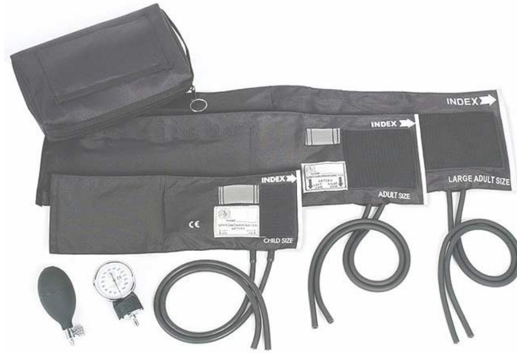
Recambios manguitos con ó sin camara para bebé, niño, adulto y obeso. Con látex y sin látex.