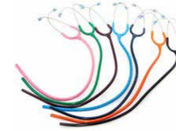
Recambio tubo de colores.