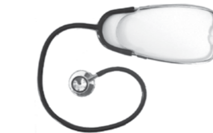
22.01.02 D-MODEL “Campana Doble”