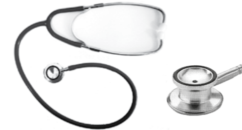
22.01.03 D-MODEL “Campana Doble Pediátrico”