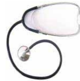
22.01.01 S-MODEL “Campana Simple”