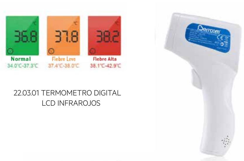
22.03.01 TERMOMETRO DIGITAL LCD INFRAROJOS