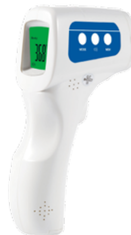
22.03.01 TERMOMETRO DIGITAL LCD JXB-178 INFRAROJOS