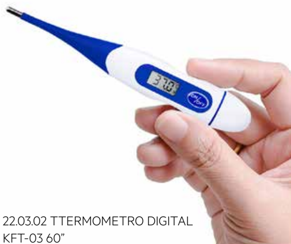
22.03.02 TTERMOMETRO DIGITAL KFT-03 60"