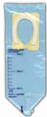
23.01.02 BOLSA DE ORINA PEDIATRICA 150cm3