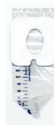
23.01.08 BOLSA DE ORINA PEDIATRICA CON VÁLVULA ANTI-RETORNO 120cm3 - ESTERIL(RG)