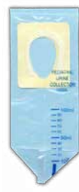
23.01.03 BOLSA DE ORINA PEDIATRICA 100cm3 - ESTERIL (OE)