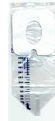
23.01.09 BOLSA DE ORINA PEDIATRICA CON VÁLVULA ANTI-RETORNO 200cm3 - ESTERIL(RG)