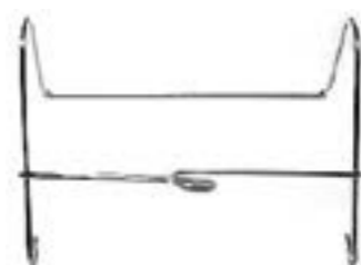
23.01.01 SOPORTE BOLSA DE ORINA CROMADO MATE (Acero inoxidable)

Acero inoxidable cromado, modelo zincado y modelo plástico.