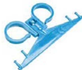
23.01.07 SOPORTE BOLSA DE ORINA (Plástico - doble posición)