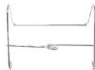
23.01.04 SOPORTE BOLSA DE ORINA (Zincado)